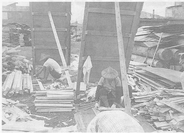
△爲了幫忙改善家庭生活，以敲板模、做苦工爲生。

的下巴，後學伸手進去把假牙拿掉，然後他就很安祥的走了。（原來人斷氣時是不戴假牙的。）