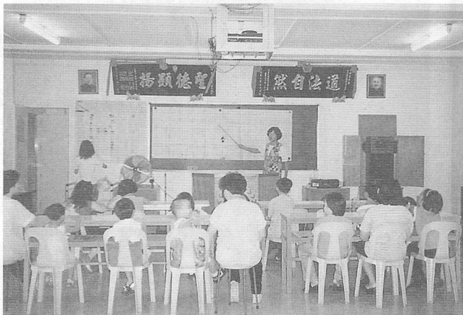
△老師耐心地教讀三字經。

內容為學習中華文化、美勞、動唱等。 開班日共有十六位學員出勤，學習態度認真，很少請假，每日下課後分別由男生、女生上中堂，向老學三鞠躬，再下樓向諸天仙佛三鞠躬才回家，由於老師的熱心教導及課程內容之生動，最後結班時，學員增加到二十一。