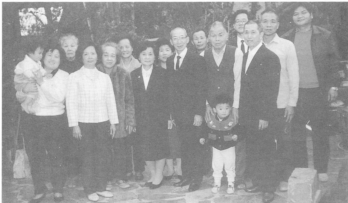
△詹前人到花東巡堂，與道親合影。

學的青年。開班時亦常要好手藝的婆婆煮豐盛的素菜藉以成全道親清口茹素。前人不僅惠及道親，更是德澤群生。若看到報載疾病困頓或流離失所的人，總要後學幫他匯錢給予適時的救助。前人總是默默的行善不欲人知。前人寬以待人，自奉卻甚儉。平日粗茶淡飯，衣著簡單。記得後學嫁過來沒多久，有一天前人拿了一件袖口已磨得「鬚鬚」的西裝上衣要後學縫補，後學不禁好奇問道：「這西裝穿多久了？」前人不疾不徐的答說：「才三十年而已。」後學笑說：「阿爸！西裝比我還老呢！」不忍拂老人家的意，只好以粗糙的手藝將其縫縫補補，只見前人高興興的將它穿上，彷彿如獲至寶。