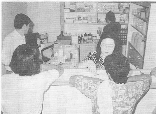
△藥劑室一調配藥物、領藥。