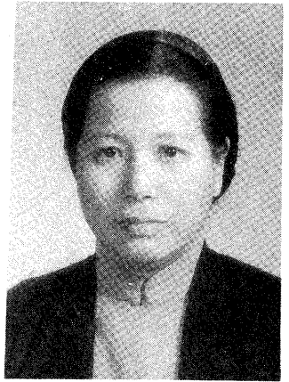
△王前輩攝於民國四十六年

凶化吉，平安歸來，但在顧前人被羈押一百天之後，由於不便傳道，於是陳前輩因對道信念堅定，誠心有嘉，而受領天命。領命後四處開荒辦道，這時的道親已由北部的瑞芳、桃園、竹南、苗栗到彰化，都因陳前輩作生意之便，寒來暑往地成全渡化，而有相當的成果。