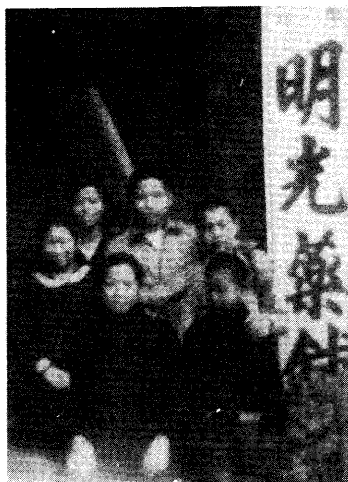
△民國四十八年時攝

母代父職，本是艱辛的工作，加上道務在身，常往來於竹南與彰化之間；最後，遇到貴人，讓其承銷玉飾，且先拿貨後繳款，如此信任與方