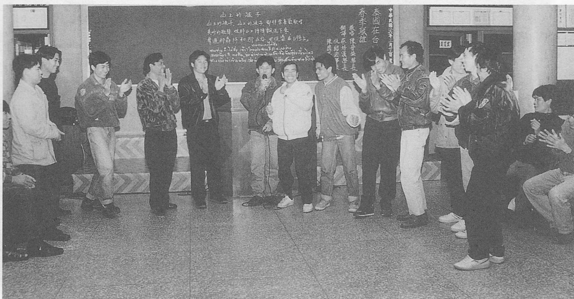
△泰國道親班，上課內容多彩多姿。

得大道，其後陸續開辦成全課程暨辦道已達八次，目前共計有一百八十二位乾坤眾求得大道，每每看到一個個皮膚黝黑，兩眼圓亮的有緣佛子，誠心地跪在中前求道，不禁令我們深深感動，上天的恩德是如此無私、源源不絕地注入在這一批又一批，離鄉背景，辛苦工作的異國道親身上，在語言不通，文化背景各異的大環境下，原有疏離感，已被「道」的光輝及道親們的大愛給漸漸融化了。