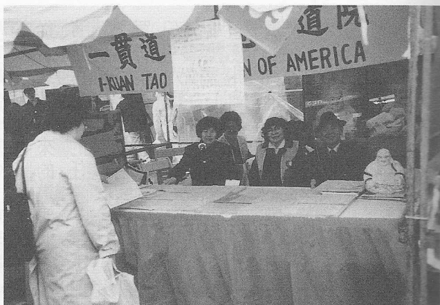
△美國忠恕道院製作之文宣品，琳瑯滿目。

雖然兩天的忙碌使大家都感到筋疲力盡，但內心都充滿了無比的欣悅，能把大道傳揚開來，讓人們了解道的寶貴，且能進而來追求真理，這是何等的高興呀。就在之後的星期