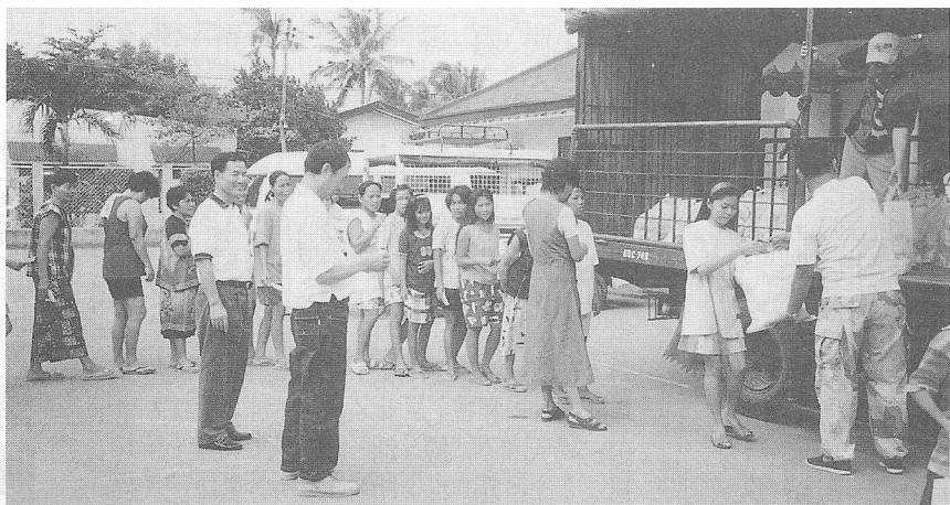
△領取著皆心存感激之情。

今年將發放三百五十包物品，內含米、糖、肥皂、毛巾、拖鞋等，這些都是道親們發心所提供的，再分裝打包，以