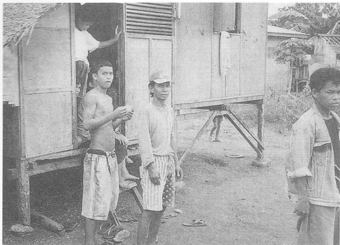
△低收入戶所住之違章簡陋房子。

由副保甲長接見，說明來意，由他帶領深入區域內，一一拜訪低收入戶，並將贈品換取單交給他們，同時約定下午在保甲辦公室換取，因他們所住的房子既是違章又簡陋，在像迷魂陣似的小巷中轉來轉去，一個上午拜訪了一百多家，如果