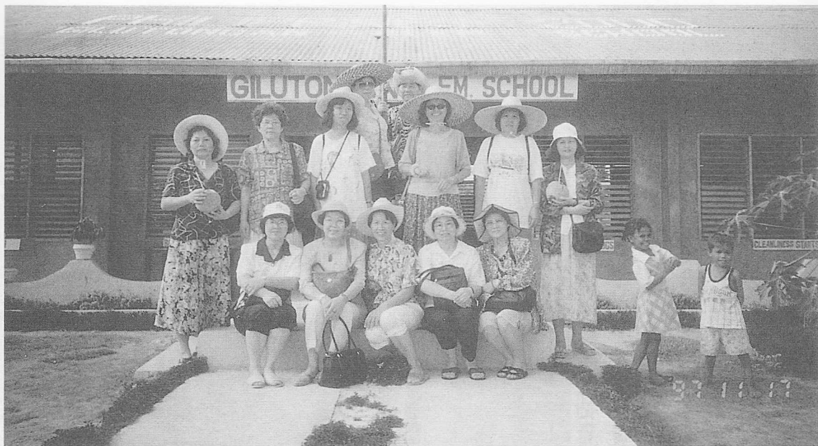
△於菲國小島上，由觀光客捐款興建的小學前合影。

消「騎馬」上山頂看塔爾火山湖全景。只在外面拍照留念，陽光普照下湖中的火山，卻在矇矓中，彷彿披上一層神秘的面紗，只能意會，不能言傳的意境。每個地方都有不同的色彩文化，真的是百聞不如一見。