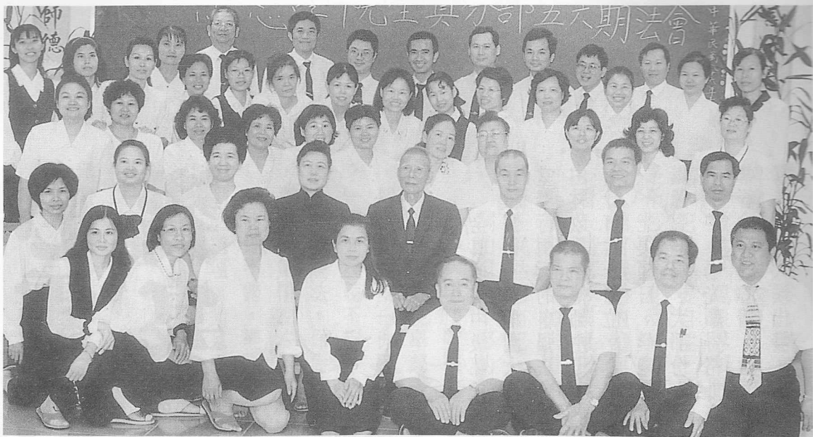
△法雨滋潤，心性放光，法喜充滿。

好的歌曲令人懷念，好的歌詞使人感動，「道寄韻律」單元的一曲「大家來作伙」娓娓唱來，欲罷不能，一句歡喜啦！歡喜啦！不但歌詞優美，且寓意深遠，深鏗人心，品嚐再三，意猶未盡。