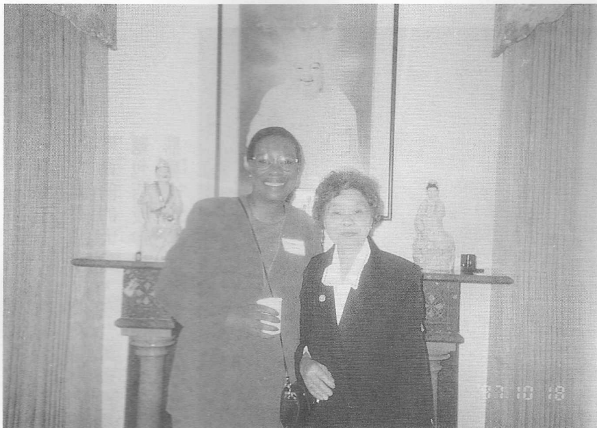
△忠厚篤實的蔡太太，以虔誠之心渡化美國婦人。

的抽象論點，在其後之百年千年，已被科學界證實為真理定論，並廣為應用。其實宗教與科學都是人類在共同業力下的產物，他們都是追求真理，追