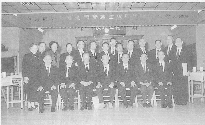
△基礎忠恕所配派點傳師，於會後合影。

一貫道總會舉辦第十一次點傳師道場觀摩會，於八十六年十一月二日星期日，下午一時三十分至五時，假台北縣新店市天祥道場明倫講堂舉行。全體出席有一五〇位點傳師，基礎忠恕配派廿一位點傳師參加，全部出席，出席率是百分之一百。