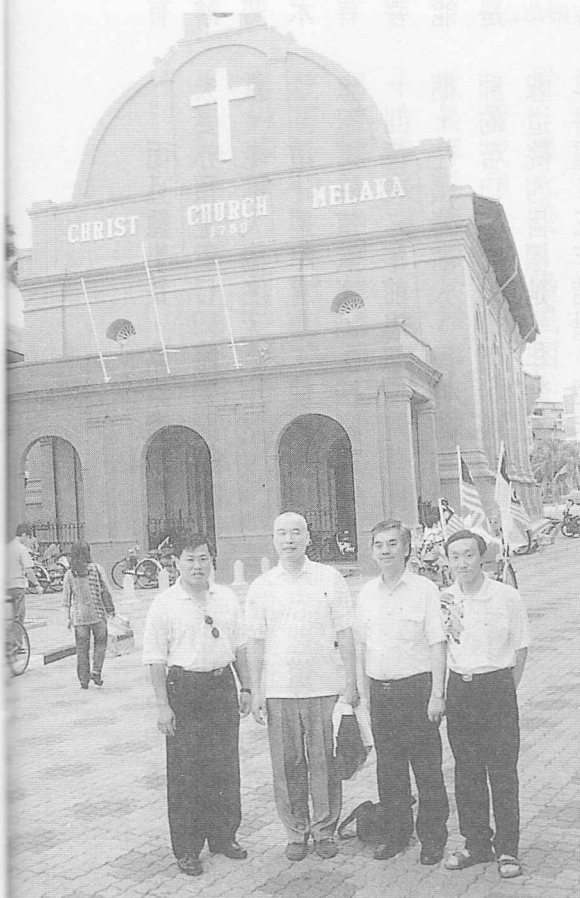
△麻六甲市的古蹟荷蘭教堂。

求道的過程更是一波三折，輾轉迂迴地大約經過一年多，機緣成熟，才能得到明師一指，回想當初後學求道不久便極積地想渡她，希望姑姑可以早日得道了解人生真諦，但每