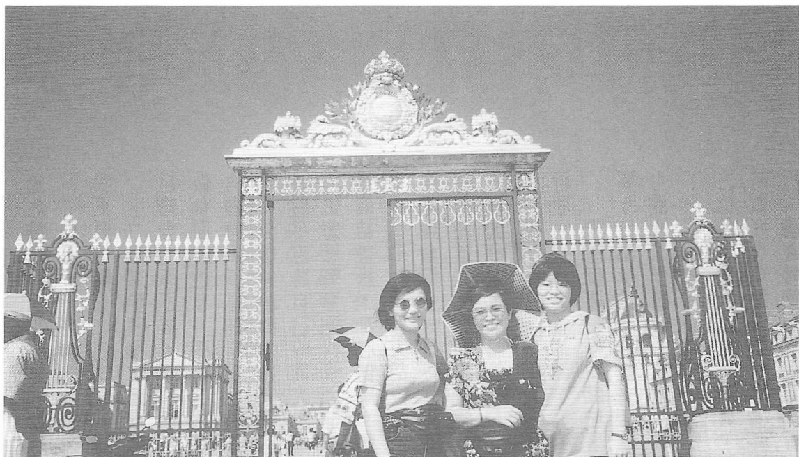
△巴黎地標艾菲爾鐵塔前回眸一笑地，正是夏綠宮—1937年世界博覽會展覽場地之一。