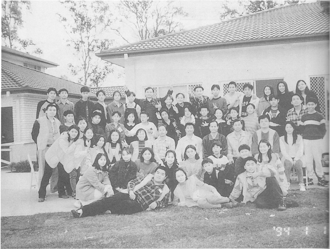
△有緣相聚—難得的鏡頭。

力量使他們的氣質產生如此神化般的蛻變呢？是青春活力的帶動唱打動了他們的心靈，抑是懾制於諸位學長之無法抵抗的魅力之下呢？當然這些都是因素之一，但我們相信最主要的動力要歸功於仙佛的慈悲及諸位學長、道親及在廚房幫忙的媽媽們在這次冬令營中所凝聚成的「愛」。這種愛是大無畏的愛，是無怨無悔的愛，也是不求回報的大愛。在這寒冷的七月中，這個愛彌漫了整個營區，拉近了彼此的距離，也溫馨了每個學員的心房。