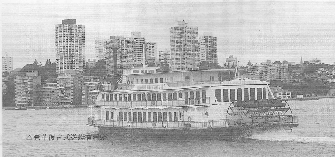
△豪華復古式遊艇有看頭。

六月七日，上午再次的環繞這南半球上的人間淨土。懷著依依不捨的心情，前往雪梨國際機場，搭乘華信航空早上十一點豪華班機返回闊別已久的台北——可愛溫馨的家園。結束這趟愉快又充實的忠恕學院東澳洲結業之旅。