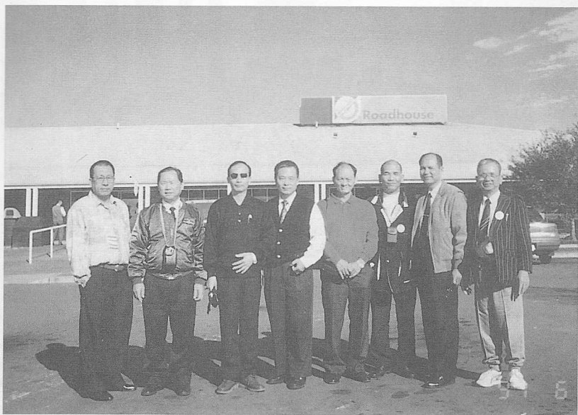
△公路休息站前（伸伸腿）。