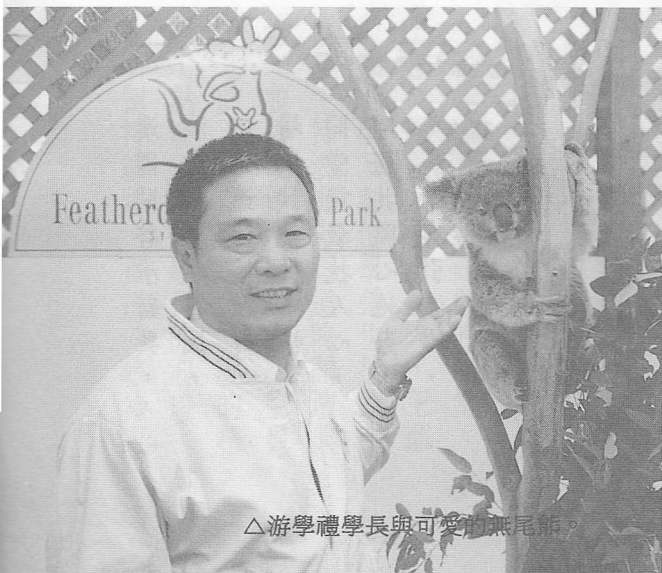
△游學禮學長與可愛的無尾熊。