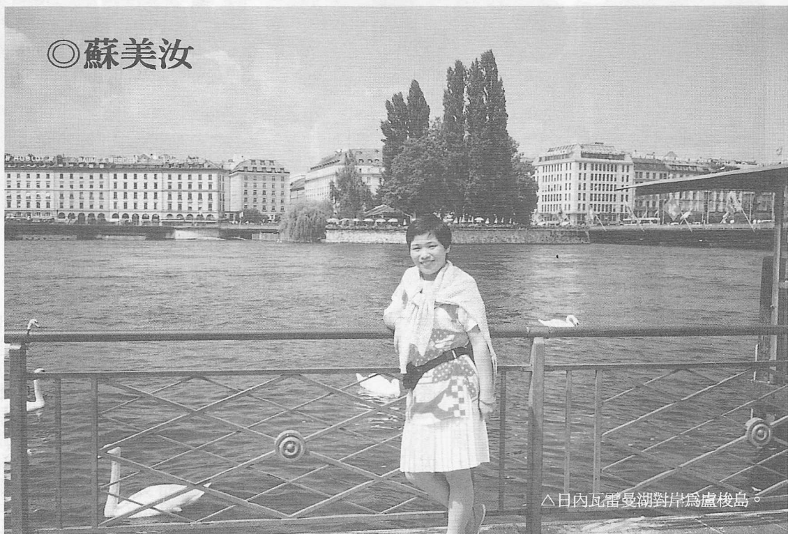
△日內瓦雷曼湖對岸為盧梭島。

「閒者便是江山主人」；放下全方位服務，忙碌得天昏地暗、頭暈目眩的工作，茫然於忙與盲，到底所為何來，乾脆來個出走，流浪去了，工作生涯中被訓練成獨立自主，「以客為尊」的行動力，所以DIY的自助旅行應難不倒我，包括辦護照、簽證、買機票、規劃路線圖、安排行程、預定房間，都一一去嚐試還真好玩。其中印象最深刻的則是到法國在台辦事處辦簽證，一開門即進去領到表格，哇塞！二十大題當中還有數小題的問答題，以法文或英文作答，除了大一還上幾堂英文文選外，離開ABC D都已經二十年了，但：只好硬著頭皮寫，連去影印好機票附上，收件了事剛好十一點三十分，辦事人員一手扶在門把上，等著把厚重的門關上，還真守時！