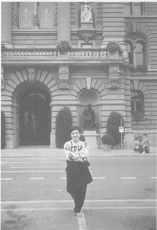
△瑞士首都伯恩聯邦議會堂前。

泊，湖面白天鵝悠游戲水，羽毛的純白及上面晶瑩剔透如琉璃般的水珠至今仍印象深刻。繞著象徵日內瓦的花鐘，他每週換植色彩豔麗的花朵，從湖岸的步道可見日內瓦象徵之一一的傑多大噴水池（噴水的高度為世界第一，有 145 公尺）的偉大雄姿，加上吉莉絲公園兩座女性紀念人像，不由的邊