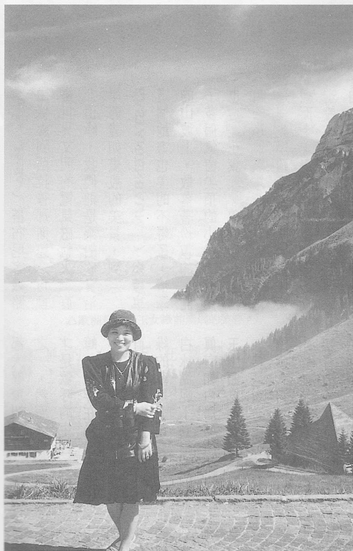
△皮拉特斯小纜車中途站中，恰似歐洲女郎。

兩個女兒第一次出國即做 DIY，擔心當然有，然年輕人很快即被彷彿遊俠般的情懷給佔滿，在飛往蘇黎士途中即跟空姐要了紙筆，三人你一段我一段寫給在台灣的爸爸跟弟弟，消遣他們倆人一下，我則清楚的寫下：「茫茫未知的旅途，我要認真面對我的人生。」