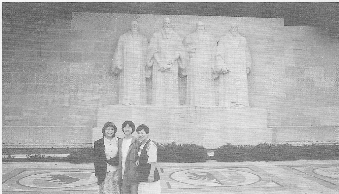
△日內瓦大學附近四偉人像加三個未來偉人（哈哈…）

接著從隧道車站通過地下道後，搭乘全瑞士最快速升降梯即可直達這座全歐洲最高的觀景台（斯芬庫斯瞭望台）海拔 3577m，哦！到了最明顯的