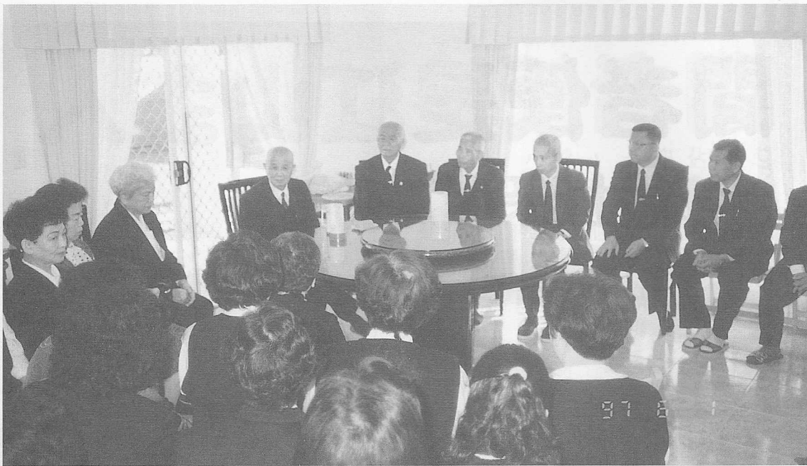
△恭聆老前人闡道，如沐春風。

布里斯本是澳洲第三大城，澳洲位於南半球，介於印度洋與太平洋之間，面積七百六十九萬平方公里，人口約有一千八百萬人，少台灣兩百餘萬人口，地大人稀。而布里斯本則位於澳洲東海岸的中部，橫跨著一條布里斯本河，是昆士蘭州首府，人口有一百餘萬人面積三八五平方公里。布市城南七十公里，有國際著名的海灘勝地——黃金海岸（City of the Gold Coast），布市華僑約有一千餘戶，大部份住城南，華人向心力強，一有聚會皆會排除萬難相聚在一起，由於澳洲政府所採取的是高所得高稅金政策，故移民來此之華僑，僅有百分之五至百分之十的人在工作的，欲由工作中來賺錢實非易事，能移民到此之人，皆在台灣稍有積蓄名望之人，來此一家人過得悠閒自在的生活。不論環保、交通、國民