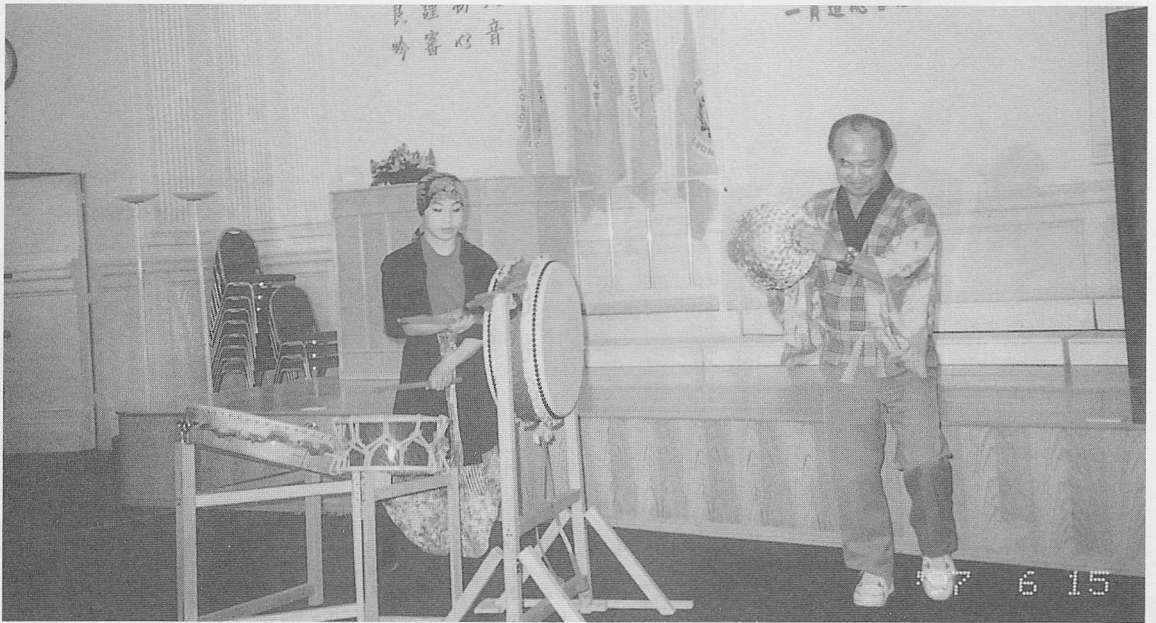
△韻味十足的太鼓合奏。