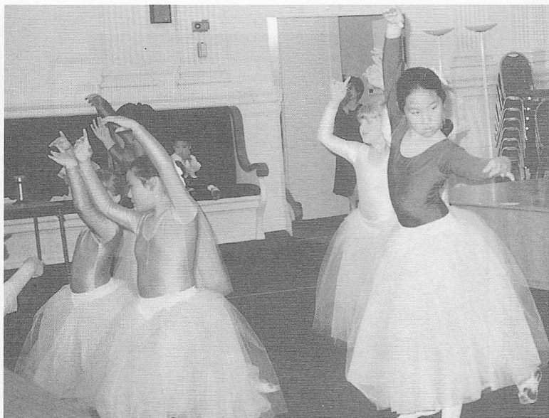
△小天使芭蕾舞天真活潑。