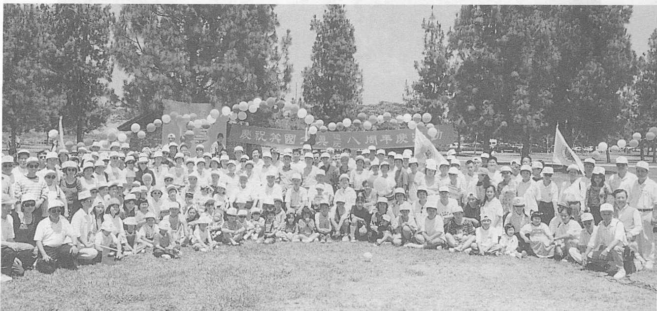
△參加活動道親大合照。