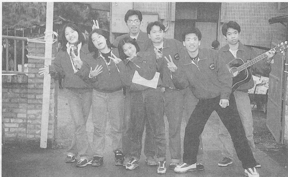
△看！吉他弦音，上台不凡。