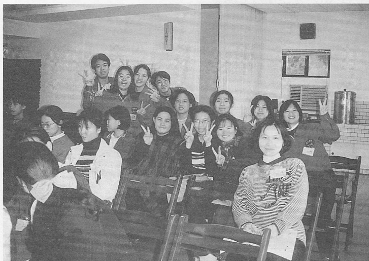
△這份情，這份緣，你我相知。