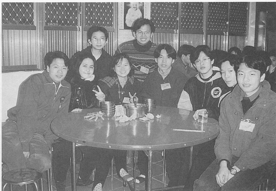
△訓練、承擔、接引青年學子。