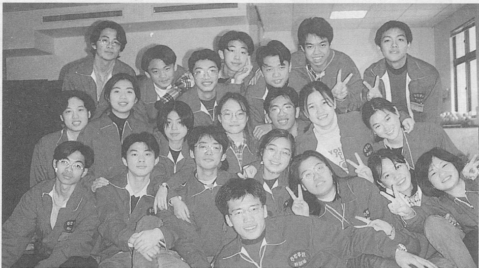
△張張笑臉，片片開心。