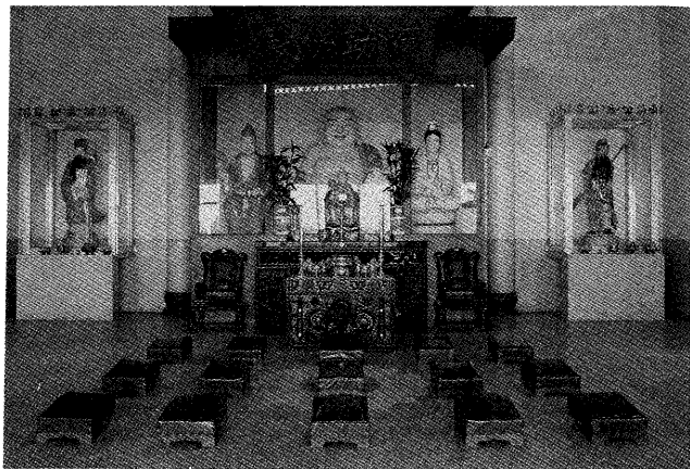
▽ 明本宮大殿莊嚴肅穆

樣，所以，他就發誓禱告上蒼，決不敗壞這塊土地的地理，只求能讓他看清楚，頓時，迷霧漸散。於是，楊貴蔘將此地有關的來龍去脈（即地理誌）刻於石碑上，埋入地底下。而這塊地理誌也就是我們剛剛提到的大石碑。現在因為年代久遠，只清晰地看見橫刻於碑頭的「奉憲嚴禁」四個大字，其他的字已模糊不清。依據流傳下來的碑