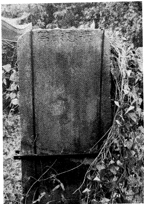
△萬丹山的地理殊勝明記於這塊石碑上，如今字跡已模糊不清了。