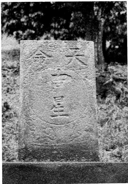
△天命吉星如今被安置於明本宮後山上

蓋的茅屋，一家數口生活恬淡，相安無事。後來人口漸多，就把茅屋拆除，翻建磚瓦屋，在翻修的過程中，從地底下挖出了兩塊大小不一的石碑，其中較小的一塊刻有「天命吉星」字樣，他們不以為然，將它擱置在後院的水溝邊，結果，隔天早上，這塊石碑却莫名地翻倒在地面，他們才趕緊把它立在屋後中央位置的大樹下，每逢初一、十五還上香；較大一塊是萬丹地理碑誌，或許太笨重了，他們也就不特意地去擺設它。當這新房子落成的第十天，這位徐姓地理師就病倒了，