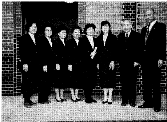
△簡前輩（右一）主持中一堂道務夙夜匪懈