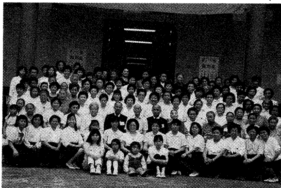
△簡前輩追隨老前人約四十載

所。然真道有真考，在民國四十二年，由於他人誣告簡前輩爲反動份子，說什麼常常非法集會，在七月時，有一天半夜，被警方破門而入，強行執監，這一關被關了二個多月，鄰人的嘯唏指點，道親的