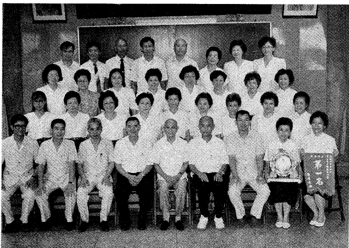
△今年度的合唱比賽中一堂獲青年及青組雙料冠軍