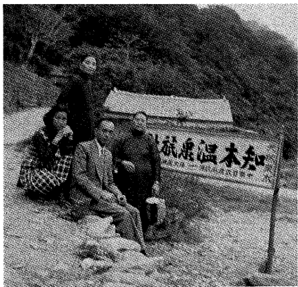
▽簡前輩（前排中）攝於台東知本溫泉

民國卅八年，簡前輩的母親因感念當時兒子多次避過劫難，且亦曾默默的許過願，如果兒子平安回來，日後定要四處去拜神還願，結果受上天仙佛的慈悲，一切順意。因此