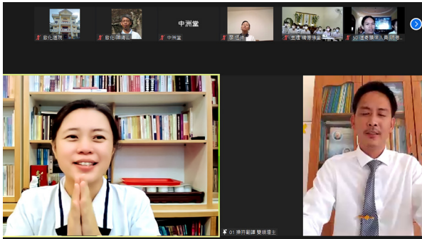
▲ 操持學長與翻譯講師引領學員討論。