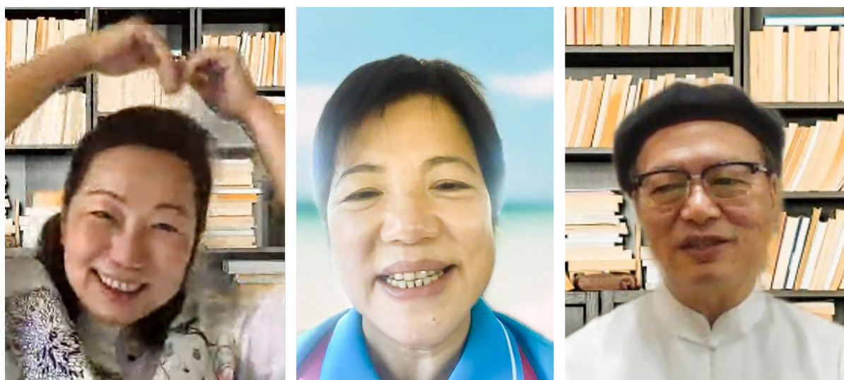
▲ 線上研習，很榮幸邀請到花蓮縣徐榛蔚縣長（左）、吉安鄉游淑貞鄉長（中）及台灣大學哲學博士林安梧教授（右）與我們空中相會。

們整個理念中，就從「人法地，地法天，天法道，道法自然」《道德經·混成章第25》做起，因應四時，其實最終也就是「返璞歸真」，這是最重要的目的。