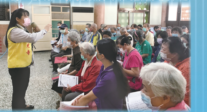
▲ 引導民眾靜心讀經。