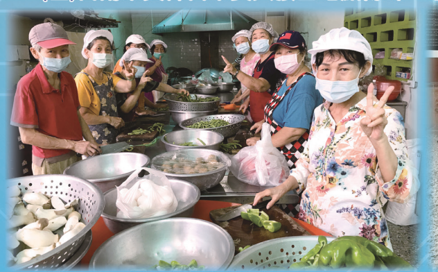
▲ 精心烹調美味素食餐點。