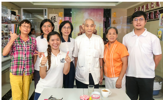
▲ 作者（前）與王老和領導點傳師（右3）在東埔寨中堂相遇。

後學回覆點傳師：「超級方便啊！就算找不到素食，可以去便利商店買麵包來吃，就飽了啊，吃素不難，就算把我餓死，我也不要再吃一口肉。」點傳師默默地點點頭，再問了後學一句：「妳還有要清口嗎？」