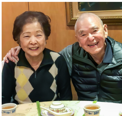
▲ 吳媽媽總是默默付出。

在吳媽媽的身上，後學也看到了中國傳統女性溫柔善良、相夫教子的美德。不是開班的時間，她見到每一位道親都會問：「吃飯了沒有？」如果回答沒有，都會做好吃的照顧大家，溫暖了後學們的心，也溫暖了後學們的胃。