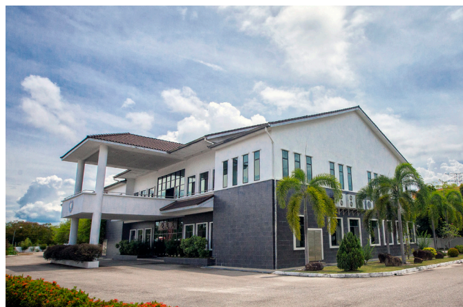
▲ 瑞周天惠單位馬來西亞檳城天慈堂。

此外，天慈堂也設立了人才培訓班，培訓辦事人員，進而讓人才能協助推展道務。另規劃有道親精進法會，藉由天人共辦的特殊因緣，使道親們感悟發心。此外，還設立有經典班和小天使班、舉辦青少年感恩營，以接引各個不同年齡層的道親。