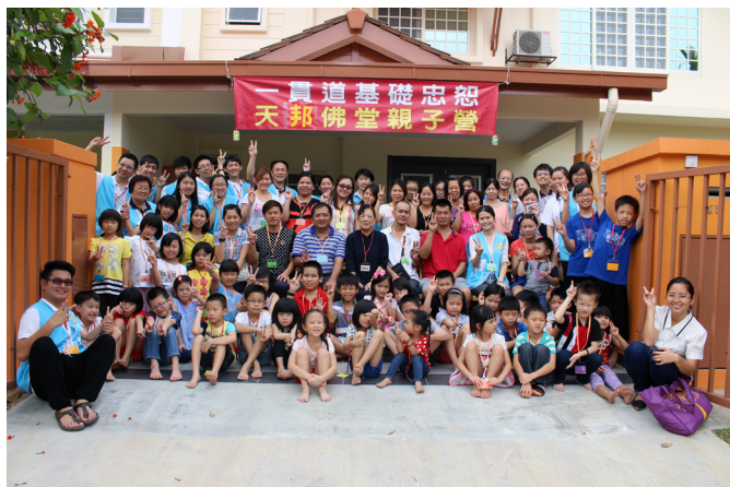
▲ 瑞周全真單位雪蘭莪州莎阿南天邦中堂。

天邦中堂位於雪蘭莪州，是一棟兩層樓的住宅；每個月在不同時段固定開班，設有綜合班、兒童讀經班、經典研究班、青少年班等班程，目前參班的道親約有 80 人左右。此外也安