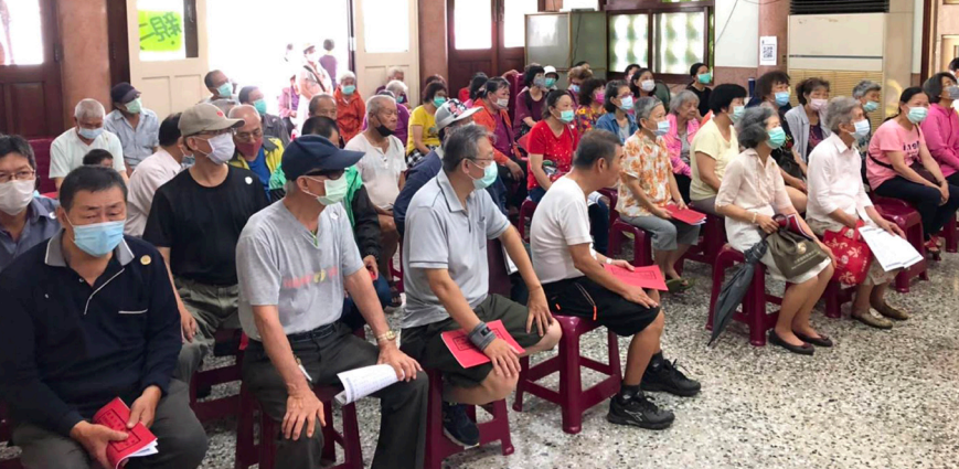
▲ 台南大光寺舉辦一日一素活動，與民眾廣結善緣。