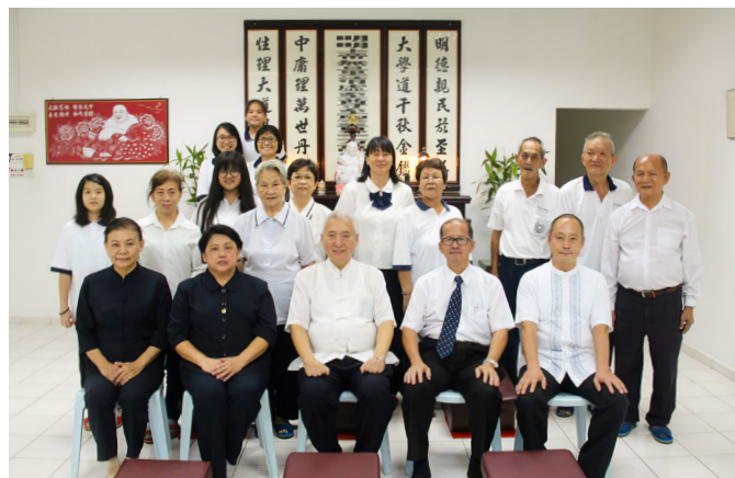
▲ 瑞周天定單位森美蘭州日拉務縣天美中堂。

天嘉中堂也透過各類活動接引眾生，歷來曾舉辦青少年生活營、捐血活動、關懷參訪老人院及孤兒院、義賣籌款、千人宴、點燈祈福及福慧之夜等活動。例如：透過青少年生活營培養道中人才，讓青少年道親能獨立自主、互敬互愛、同心合力，並能將道展現在日常生活中。此外，馬來西