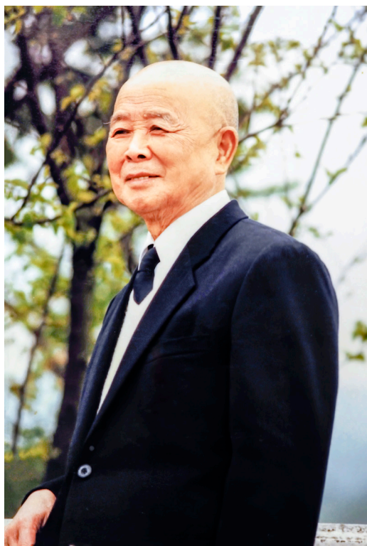
▲ 基礎忠恕後學緬懷老前人。

基礎忠恕道場採地方單位制，十幾年前老前人就說要「整合」，他老人家親自對我說：「現在我開始在整頓，整合、整合、整合！」先前大家打拼、努力，但努力到一個因緣成熟，張老前人覺得這樣下去會變成一盤散沙，有開花卻不結子、沒結果，所以他下定決心來做！張老前人說他要一年一年整頓，循序漸進。我想：「老