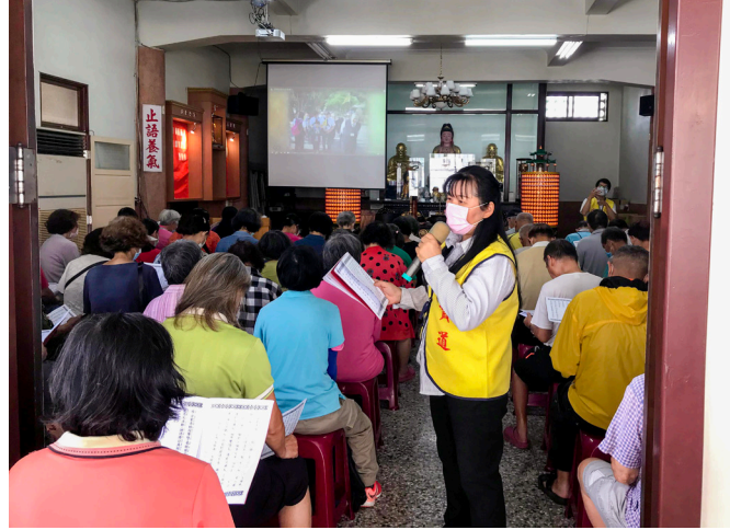
▲ 參與者都願響應一日一素祈福消災。

活動初期，除了前兩天有人擔心拿不到便當，早早地 7 點多就在門口等待外，之後都大約 10 點半才開始陸續有人來；11 點發完號碼牌，後學就利用領取前的空檔，帶動大家讀經；到 11 點半的時候，開始安排由 1 號到 10 號、11 號到 20 號……，每次 10 位、10 位地請大家依序領取便當。所以現