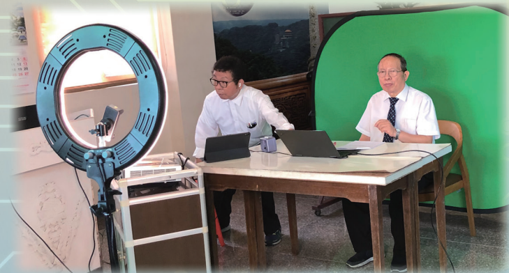
▲ 透過各項設備使直播更順暢。