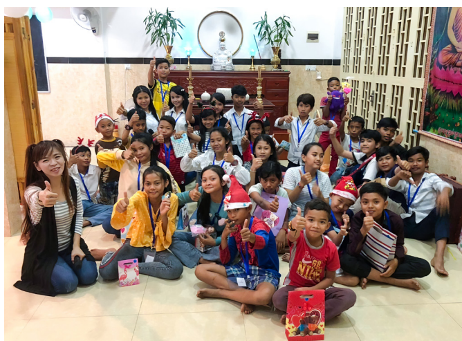
▲ 與來天國堂學習中文的當地學生合影。

在 2019 年的農曆年之前，後學帶了後學的孩子到東國去走走，讓她知道媽媽在東國做些什麼；讓她了解後，或許將來後學可以常來。15 天後回國，後學的內心有一個聲音：「去一年吧！『雪中送炭』要下雪時送，才有意思。」