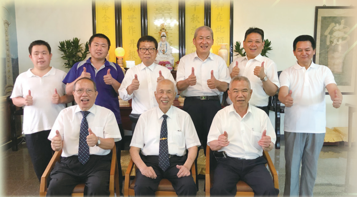
▲ 總領導點傳師與協助的點傳師、工作團隊合影。