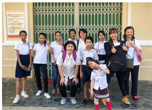
▲ 女兒小西瓜於 2019 年農曆年間一起來柬埔寨。

因此，後學在民國 108 年（2019）4 月 1 日，坐上了飛往東國的飛機，前往東國了愿。