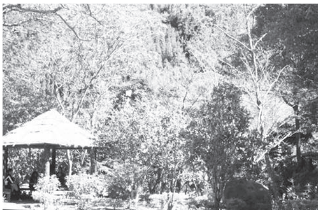
▲ 風景如詩如畫的八卦力部落。

八卦力地名據記載，日據時代此地有八個山頭，中間這一塊初陵地叫作八卦力。還未開發前，有許多的科類喬木大樹，進來好像走入八卦網一樣（部落說法），又稱為老鷹的故鄉，非常多大斑鳩、老鷹喜歡在科類喬木上築巢以及盤旋，開發後，老鷹已經很少了，但是更山上會更多。