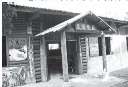
▲ 保存最完整的建築餐廳。