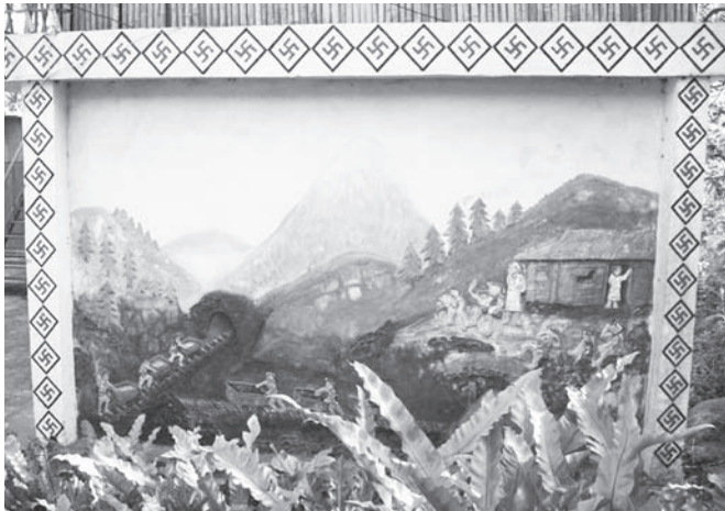
▲ 雷女教種植與織布。

3. 出草 ：原住民會有砍人頭的動作，以賽夏族來講，在秋收時，會由長老以及勇士，大家協議今天要攻打那一部落，獵取多少人頭，這種習