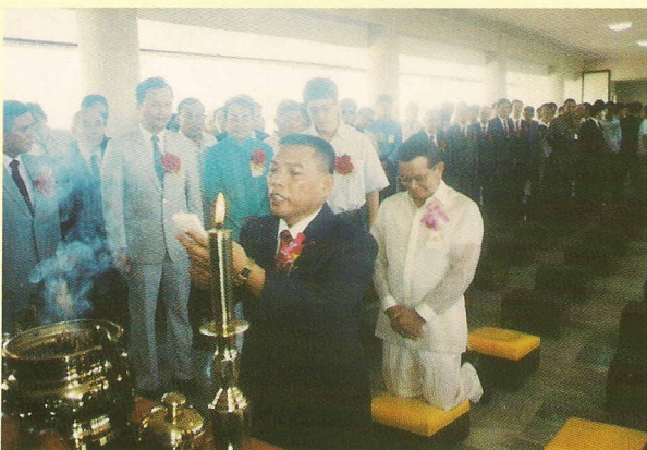
△副總統勞瑞爾先生跪聽讀表。