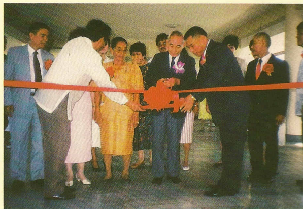
△恭請袁前人代表 老前人剪綵、開堂。