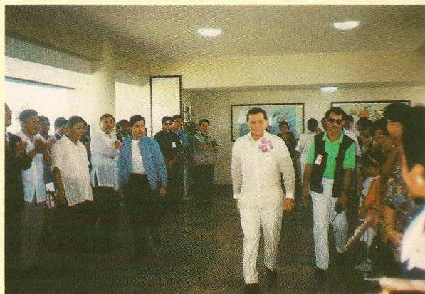
△菲國副總統勞瑞爾先生蒞臨祝賀並求道。