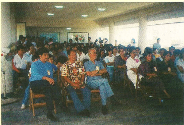
△一貫宏展，道親滿座。