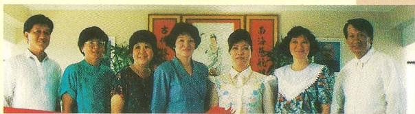
△三寶顏中堂的辦事人員。

除了當地的許多傑出人士；包括市長夫人及地方仕紳都一一出席外，參與的人員還有各大眾傳播媒體、華僑社團及一貫道道親們，整座先天道院可說洋溢一片熱烈又歡欣的景象。我們除了分享這件喜事之外，並祝賀三寶顏先天道院善緣廣結，道務鴻展。