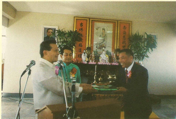
△副總統親贈林經理紀念禮物。