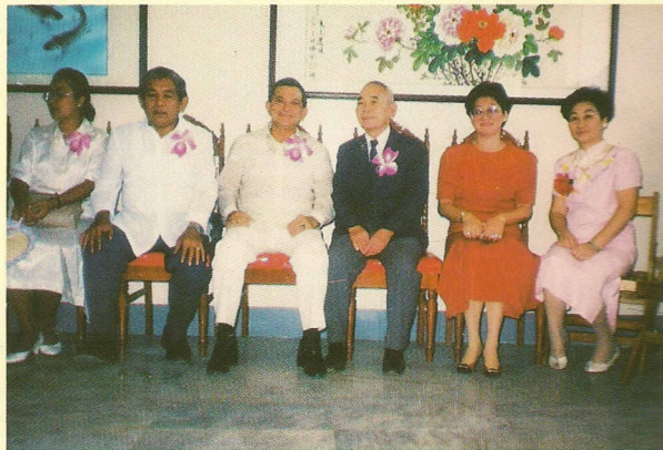
△袁前人和諧位嘉賓們！（左二、一為三寶顏市長及夫人）