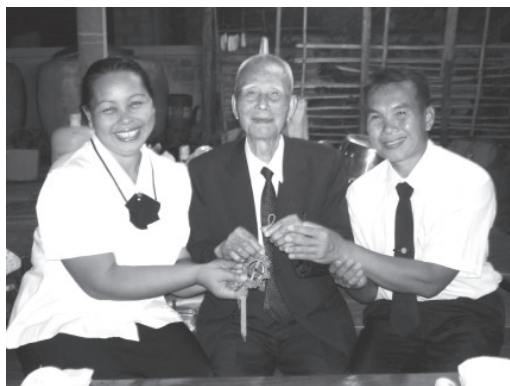
▲ 陳前人(中)贈送手環予宋偏壇主夫婦。

三月十三日法會當天有一壇主開設中堂，前人慈悲難得在他鄉萬里外共聚一堂，前人很高興，很開心要送我們大家禮物。是一對手環詩及古詩，今把它轉贈與各位前賢分享。