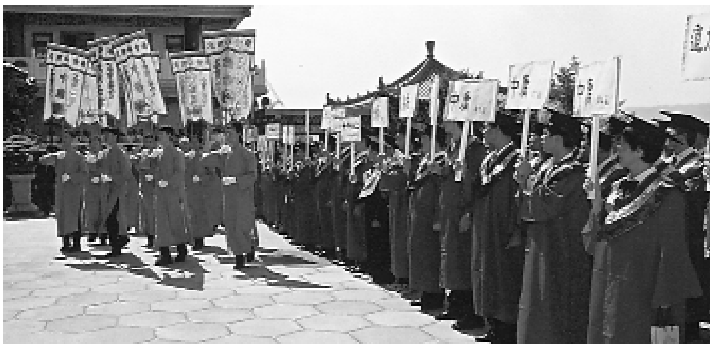
大狀元讀經會考，成果輝煌。

慧往上提昇。今年一貫道世界總會讀經會考，最高年齡九十二歲，背了三、四千字，將四書大學篇倒背如流，贏得滿堂喝彩，這是天大的挑戰。經典也翻譯為外文，提供各國道親應用，希望道傳世界，能從此展現。