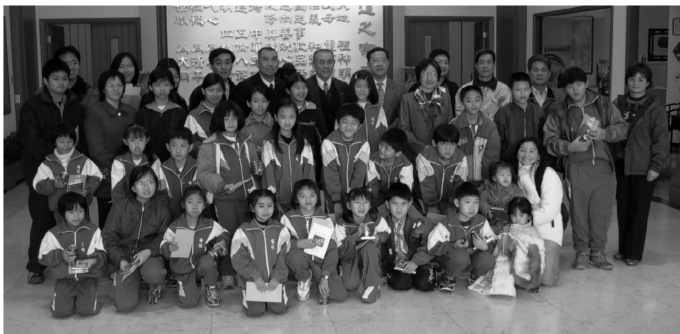
全體合攝於忠恕大樓迎賓廳。

們的支持和關心，這份緣永遠續下去，我們懷著感恩的心，來參訪、了解、也拜訪所有的道親長輩，也讓小朋友知道，提供獎學金的是我們的道院；了解源頭，將來能夠培養感恩回饋的心。