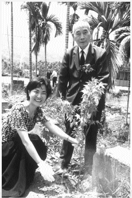
袁前人與朱校長(左)共同植樹，象徵「德澤廣被」。