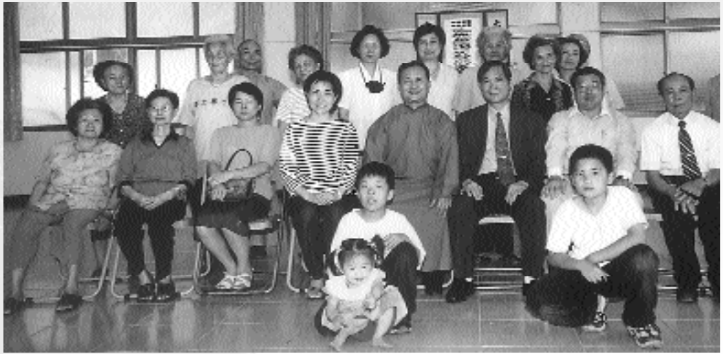
「感恩祈福法會」中，同沾天恩，求得寶貴大道。

近六十萬元，希望同學們藉此機會好好學習，今日你們以學校為榮，明日讓學校以你們為榮，這份溫暖和愛，將使學校學生將來能有所成就，來回饋點滴……」