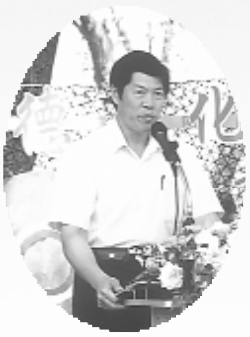
教育局高督學於會中致詞。

們都能武功高強：第一功：品德高超，第二功：學識豐富，第三功：人際圓融，第四功：體格強壯，第五功：智慧變大，具備這五功，將來可以做