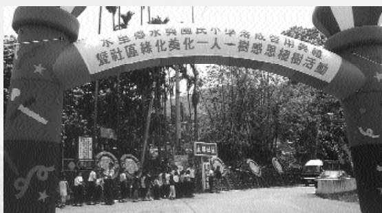
學校重建落成，全村共同慶祝。