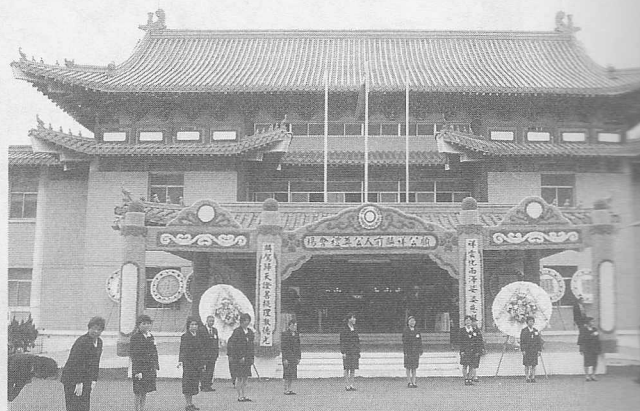
△顧前人公奠禮會場「景行廳」一景