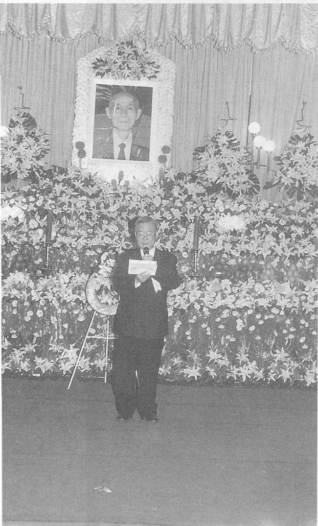
△總會施理事長為顧前人作生平介紹。